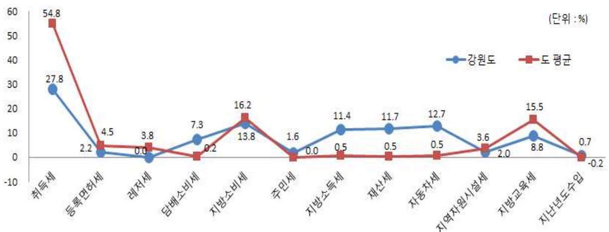
유사 지방자치단체와 지방세징수액 세목별 비중 비교