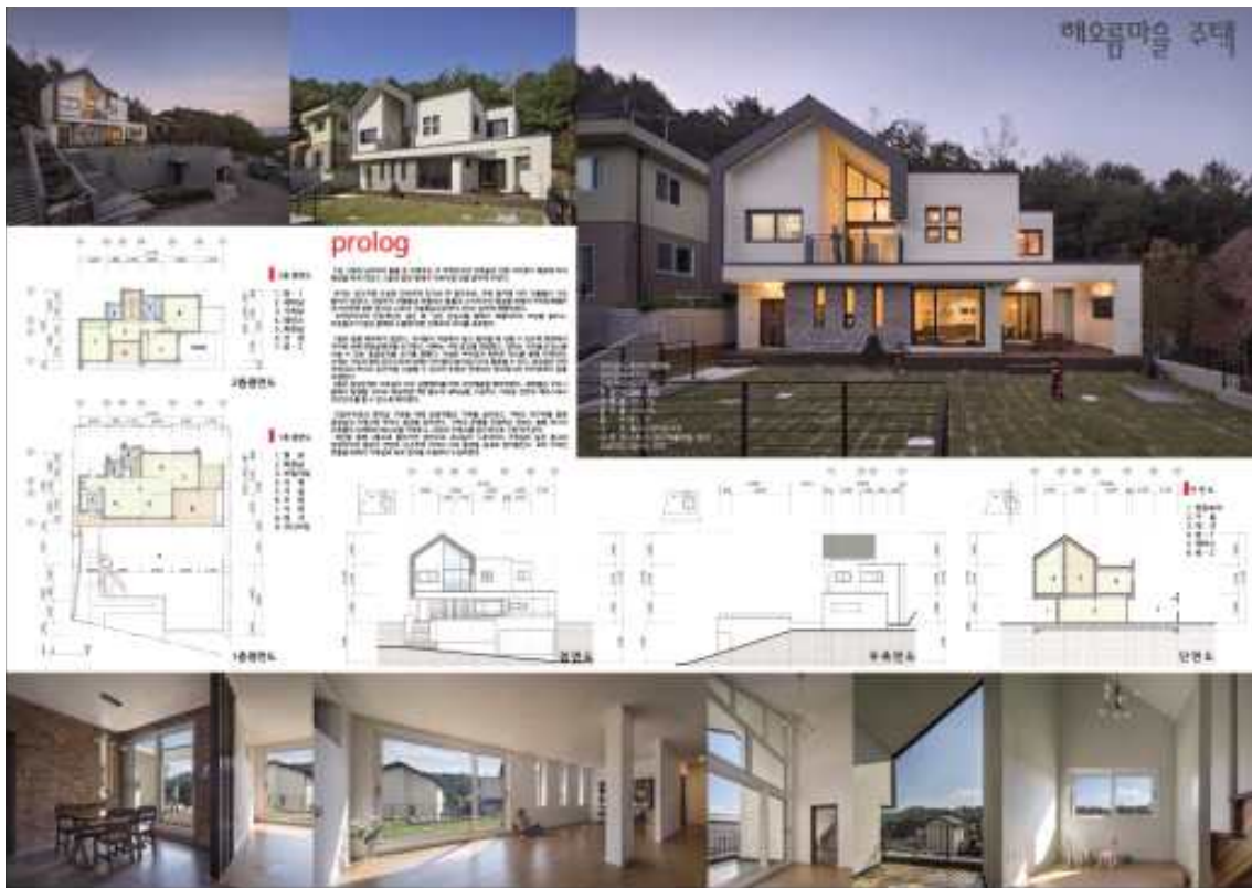
우수상 : 건축사사무소 품은(이승철) : 해오름 마을 주택