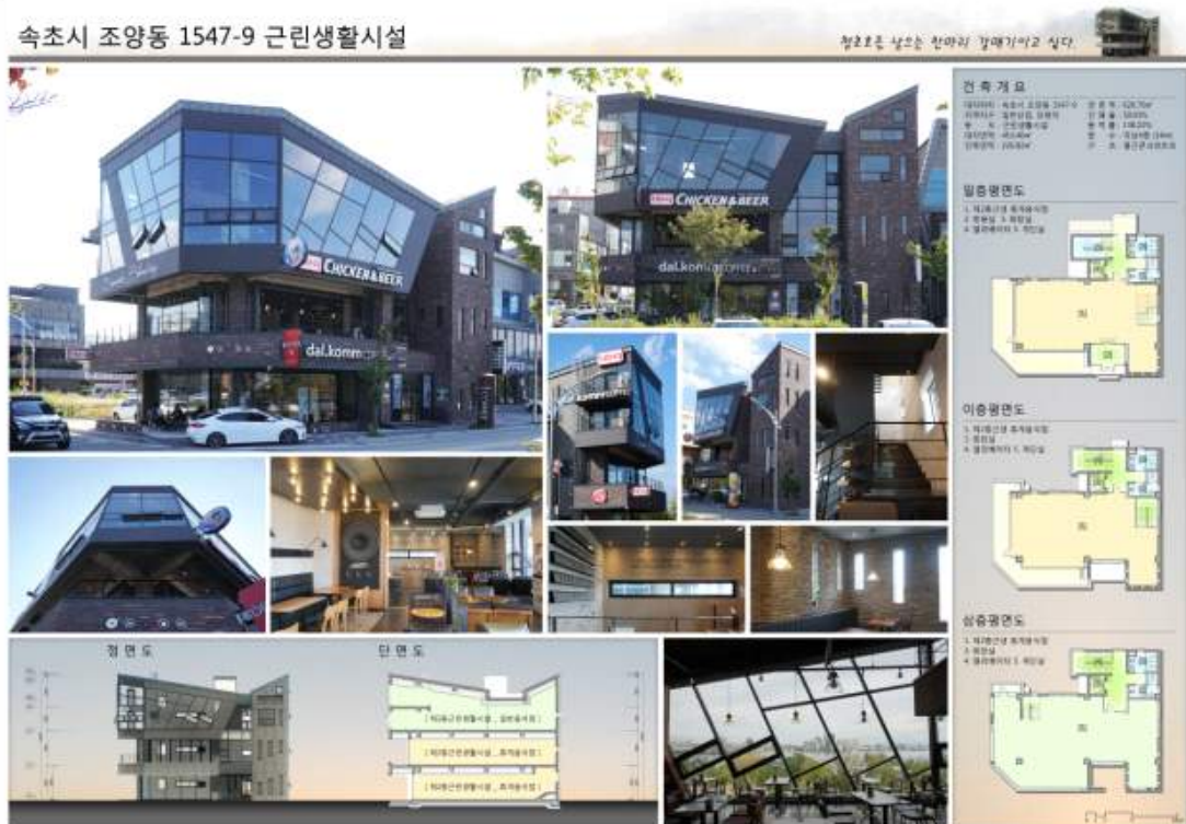
장려상 : (주)건축사사무소 아키라인(최성두) : 속초시 조양동 1547-9 근린생활시설