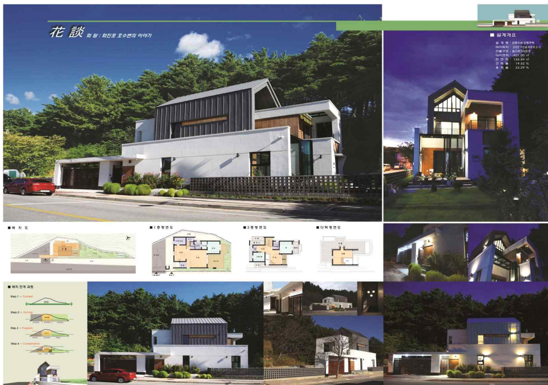
최우수상 : (주)형제케이종합건축사사무소(김상수) : 김동수씨 단독주택(花談)