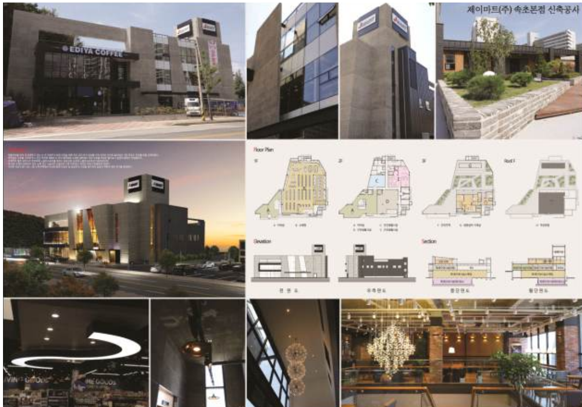
우수상 : 미가 건축사사무소(변정희) : 제이마트(주) 속초본점 신축공사