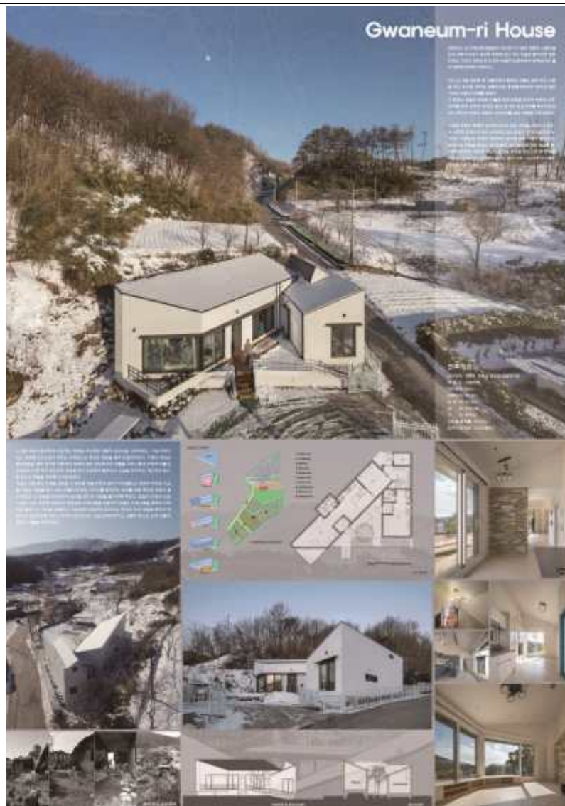
장려상 / 건축사사무소 예인(최이선) : 관음리 주택