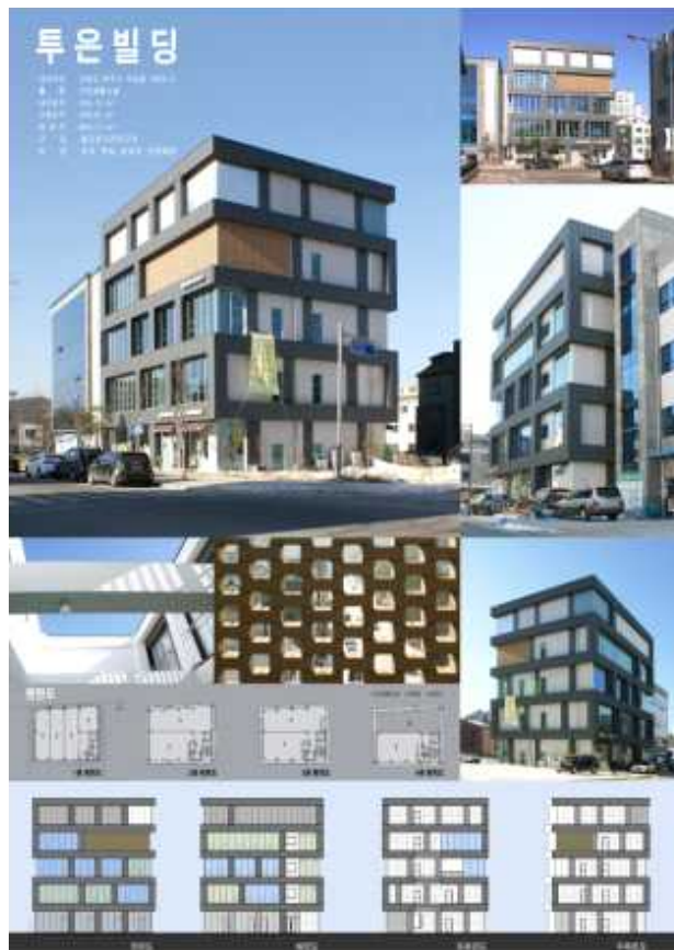
장려상 : 백강욱 건축사사무소(백강욱) : 투은빌딩