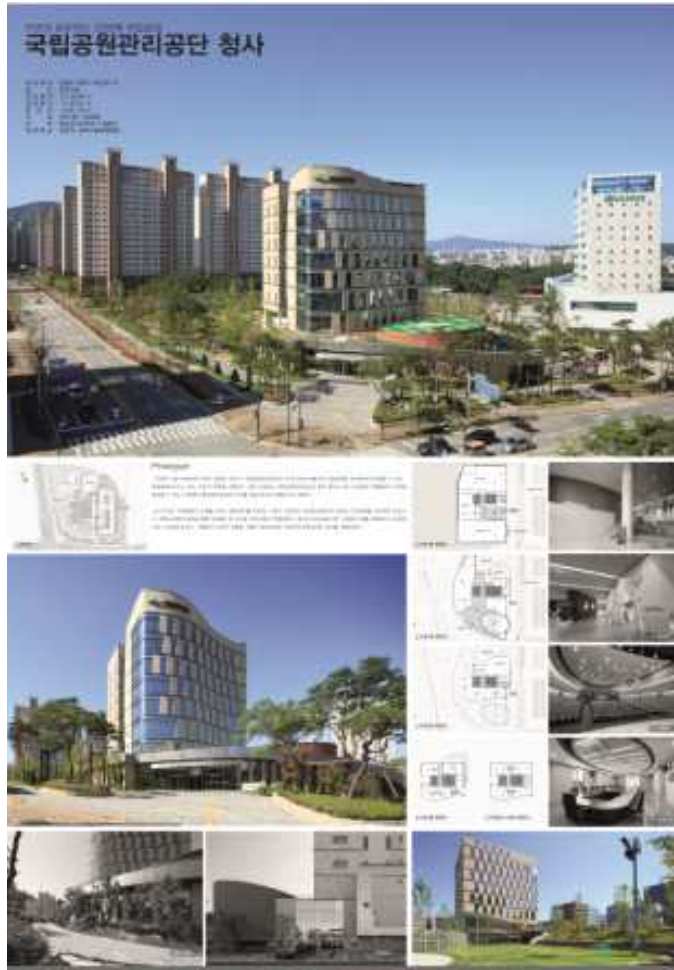
특별상 / 다인그룹엔지니어링건축사사무소(이경희)/(주)디엔비건축사사무소(조도연) : 국립공원관리공단 청사