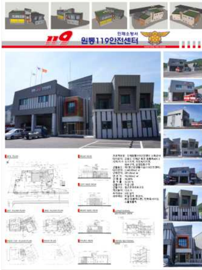
장려상 / 칸 건축사사무소(전영석) : 원통 119 안전센터