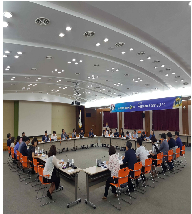
시·군 관계자 회의(6. 22.)