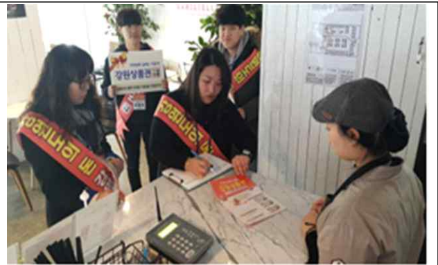
점포 방문 홍보