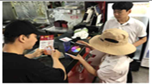
점포 방문 홍보(이벤트 진행)