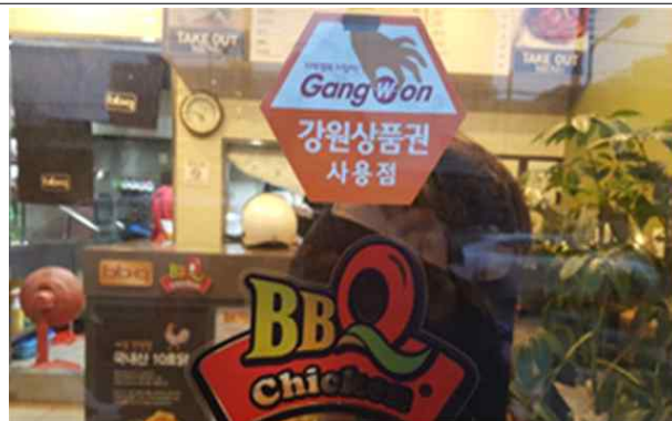
사용점 스티커 부착