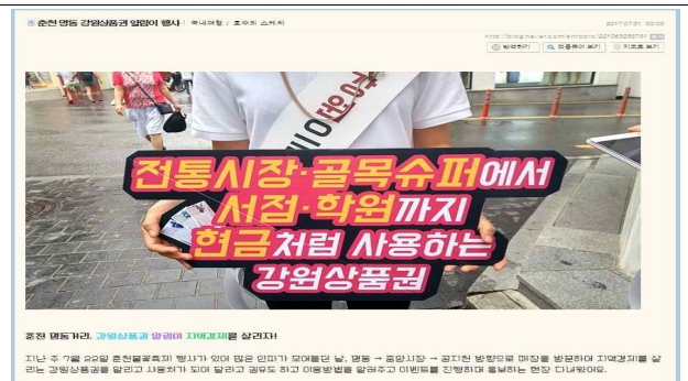
강원도 SNS서포터즈 보도기사(블로그)