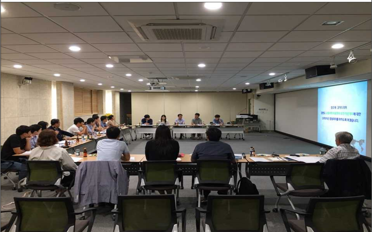
◆ 교통약자 이동편의 증진 지원계획 수립과 관련한 시군 합동회의