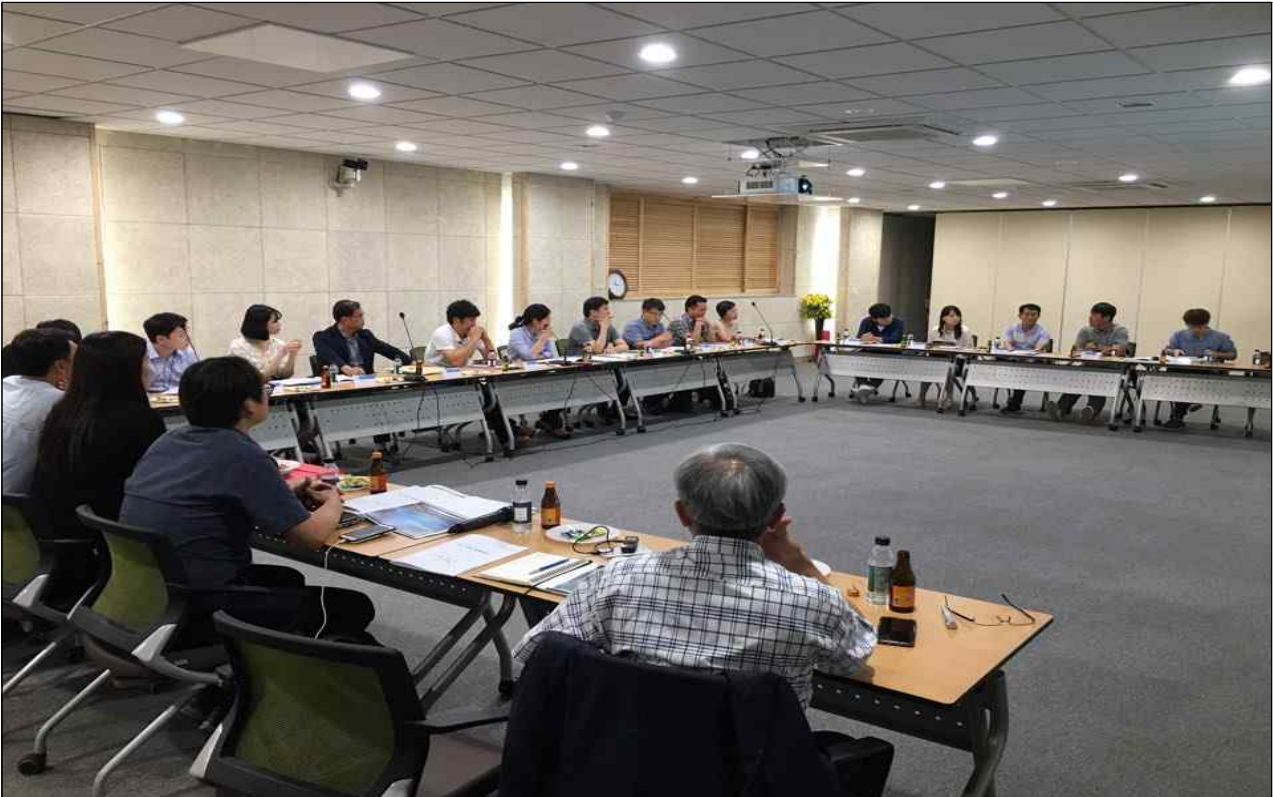
◆ 교통약자 이동편의 증진 지원계획 수립과 관련한 시군 합동회의