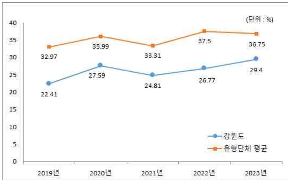
강원도-유형 평균 재정자립도(당초예산) 비교