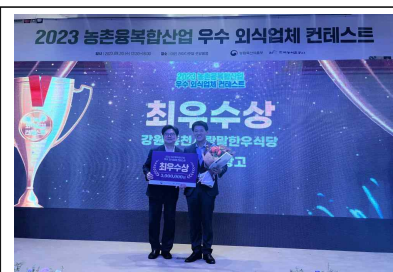
농촌융복합 우수사례 발굴