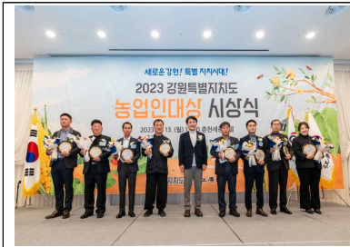
농촌마을 활력 프로젝트

- 농촌협약 체결(정선, 589억원), 청년보금자리(1개소, 80억원), RE100마을(2개소, 34억원)