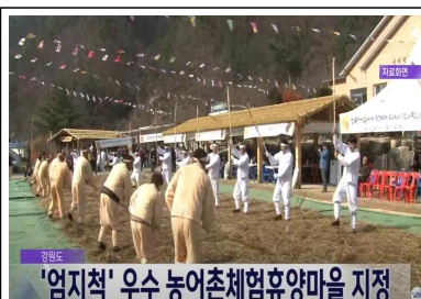
명품 농촌체험마을 육성

- 6차산업 인증확대(280개), 마케팅·판로지원(안테나숍 11개소, 지역상생제품 개발)