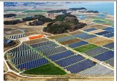
RE100 재생에너지 설치